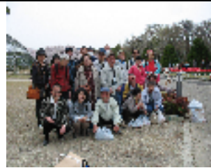
【皆さんハイチーズ】