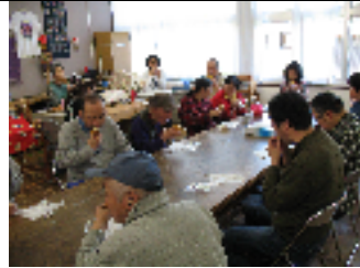
【 お誕生会♪ 】