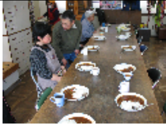
【 デリーシャス 】

今回のメニューは「ビーフシチュー」でした。お野菜が安く購入できたので、牛肉は「登喜和」さんのお肉にしました。とっても軟らかく美味しく出来上がったと思います。Tさんが初めての調理の予定出したが、都合が悪くなり、欠席され残念でしたが、次回にできれば又お願いしたいと思います。次は何にしようかなー？・・・・・・・・