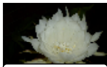
今月の花月下美人

NPO しゃくなげ 京都市右京区京北周山町高梨子 12 電話&FAX 0771-52-1945 http://shakunage.com/ kss@shakunage.com 発行責任者 林 隆男