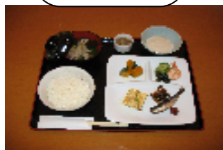
ちりめん・とろろ定食