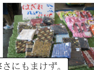
雨にも負けず、寒さにもまけず。