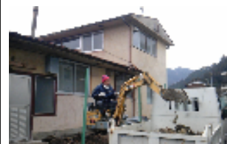
コンクリート打ちも、重機のオペも、自分達で!