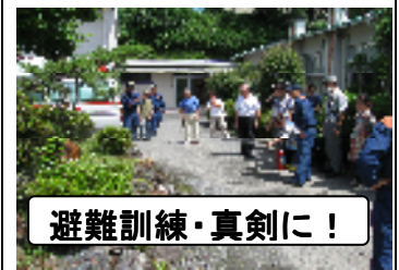
避難訓練・真剣に！