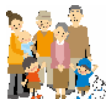
福祉施設のネットワーク♡

19日サンサ右京にてU-net連絡会が行われ、右京区の加盟施設全体の「事業所カタログ」の製作や、学習・交流会についてや、今回のテーマ「人材確保」などが、会員により協議されました。