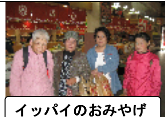
イッパイのおみやげ