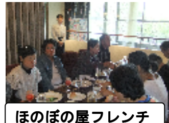
ほのぼの屋フレンチ