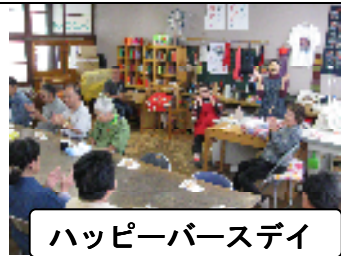
ハッピーバースデー

11月3日、京北ふるさと祭りが盛大に催されました。ステージでは各イベントが行われ、今年は大声大会もあり、当作業所の大声自慢の女性職員さんが参加されました(実父に敗退・父は強し)又、作業所出店の屋台も好評で、とても寒い日でしたが、利用者さんもハリキッテ接客対応していました。作業所の利用者さんから持ち寄りのバザーは特に大好評でした、他今までの古い商品も在庫一層でお安くして皆さんに購入していただきました。屋台の前ではラーメンを販売していて長い行列ができていて、美味しそうな匂いがたちこめ、食欲をさそい、利用者さんはめいめいに好きなものを食べていました。来年もヤルゾー!!!