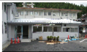
シンボルツリーも完成

改装工事はすべて順調に予定どおり進みました。10月31日には、地元の高山建設さん及びTMコーポレーションの高村さんに依頼した駐車場の舗装工事が完成。また職員の公募は、10月末に新聞折込募集広告を行い、ほぼ決まりました。不足の時間帯については、ボランティアさんをお願いして、地域の要望どおり職員配置を行い、地元より4名の方の雇用協力で、地域の活性化にも期待する所です。今後の予定として、11月15日以降に開設準備として、備品搬入・職員の研修等の後、 12月1日開所、3日開所式 の予定です。