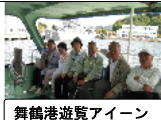
舞鶴港遊覧アイーン