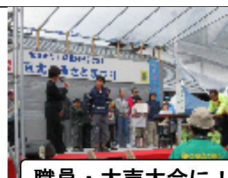
職員・大声大会に！