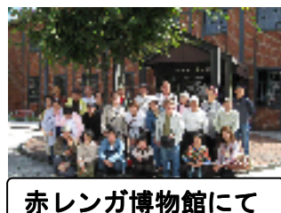
赤レンガ博物館にて