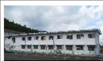
屋根も外壁もピカピカ