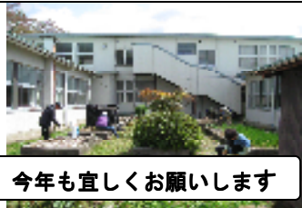
今年も宜しくお願いします