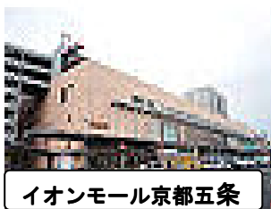
イオンモール京都五条