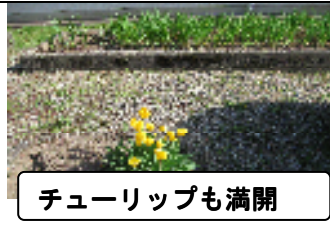
チューリップも満開

4月19日、本年度も京北民生委員さん障害者部会8名のボランティアによる、作業所の畑作業が始まり利用者さんと一緒に畑の掃除やジャガイモ等の苗植えをしていただきました。京都市の民生委員さんの中でも、京北の民生委員さんは、行動的で作業所等との交流も活発だと市内の他の作業所さんは、驚いておられます。利用者さんとも顔なじみになり、“ひさしぶり”など、声をかけながら作業を楽しんでおられました。今年も10月まで宜しくお願いします。