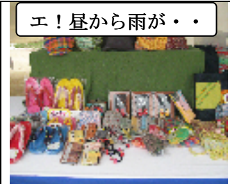
エ! 昼から雨が・・・

5月19日(日)第47回障害者ふれあい広場「スポーツ・レクレーションフェスタ」が丹波自然運動公園にて催され、障害者をはじめ多くの府民が参加し、共に楽しみ、交流する事を通じて、障害者スポーツの振興と、障害者に関する理解の促進を図る趣旨によって行われ、当作業所も出店致しました。いつもの作業所の名物指導員がいきましたが、あいにくの午後からの雨で少し残念な結果となりました。☹☹