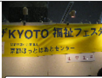
さすが駅ビル、人は多い