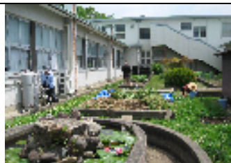
良い天気になりました

5月7日、21日と二日間、民生委員さんと、利用者さんで畑作業がおこなわれました。とっても良く晴れた日で、皆さん汗をかきながら、万願寺や、サンド豆などの種まき、畑の土壌づくり、草刈等をしました。また、皆さん一緒に休憩をして歓談し、楽しみながらの畑作業となりました。夏野菜の収穫が今から待ちどおしいですね。♪