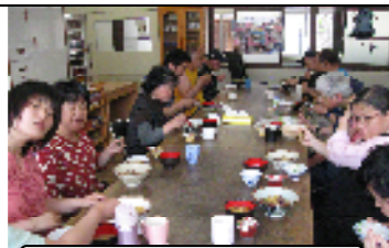
旬の豆ご飯・最高!