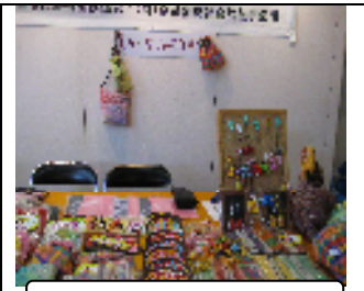
なんととっても駅ビル

20日、第58回「ハートプラザKYOTO福祉フェスタ」が京都駅ビルにて催されました。ほっとはあと主催で、年に3~4回あり、毎回出店しています。こちらも名物指導員が行き、毎回好成績を上げていますが・・・今回は平日の月曜日と言うこともあり、前日のスポーツフェスタに続き少し不調でした、ただ布ぞうりが3足販売できたのが救いでした。次はガンバ!