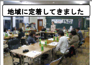
地域に定着してきました

5月10日、作業所にて 第六回通常総会 が開催されました。会員20名(委任状提出4名)のもと、事業報告、決算、事業計画、予算書等の審議がなされ承認されました。また今年には役員任期改正の年で、理事2名の辞任と、新理事3名の就任も承認され、 25年度新役員一新 となり、NPO法人しゃくなげの、福祉事業サービスのさらなる拡大を目指して、皆さん一つとなり頑張っていきます