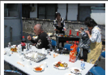
美味しい肉に下包み♪