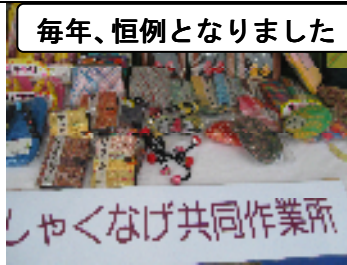
毎年、恒例となりました