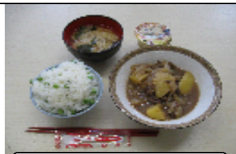
デザートはプリン♡