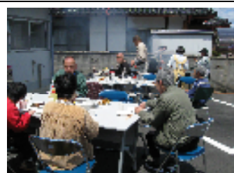
盛大にやきにく大会！

5月3日、ゴールデンウィーク後半初日、やちよ荘広場にて、 焼肉大会 を催しました。まさに五月晴れの良き日で、やちよ荘と作業所の利用者さんや職員他、多数で、盛大に行いました。朝早くに市内のミートショップで、美味しい肉を買出し、炭をおこして、皆さんで楽しみました。少しお酒もはいて、わきあいあいと盛り上がりました。久しぶりの日光浴に少し肌も焼けたかな？