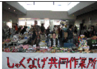
サンサは福祉の味方