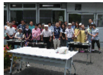
食事前、皆さんチーズ