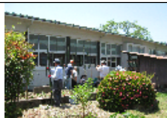
初収穫も始まりました

今月は6月4,25日の2日間、民生委員さんと利用者さんによる、作業所の畑作業がおこなわれました。畑に草刈機を持込んで、除草していただきました。とっても暑い日でしたが、本当に有難うございました。又、夏野菜の苗植えも完了し、とても立派な万願寺唐辛子の初収穫も出来て、皆さん、喜んでいきます。