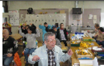
利用者さんと体操 ♡