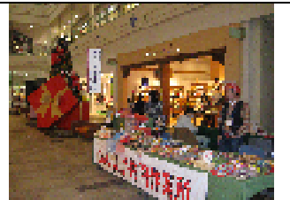
クリスマスシーズン到来