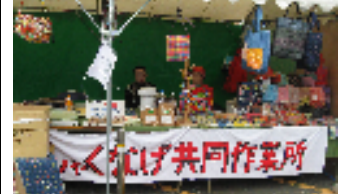
今年も出店しました