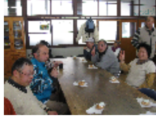
お誕生日おめでとう！