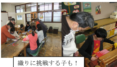
織りに挑戦する子ども！

障害についてのお話の時は緊張していた様子でしたが、2班に分かれての作業体験では、楽しく取り組まれていました。